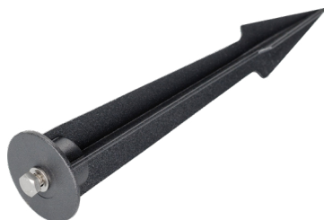
Рис. 3. Основание для установки в грунт [ALT-SPIKE-210, арт. 024889].