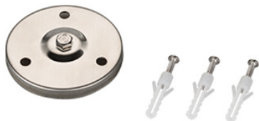
Рис 2. Основание для установки на поверхность [ALT-BASE-R75, арт. 024890].