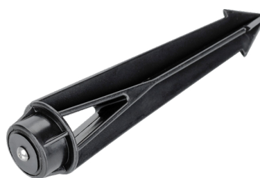
Рис. 3. Основание для установки в грунт (ALT-SPIKE-175, арт. 024888)