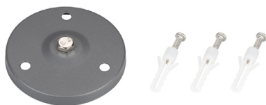
Рис. 2. Основание для установки на поверхность (ALT-BASE-R75, арт. 024890)